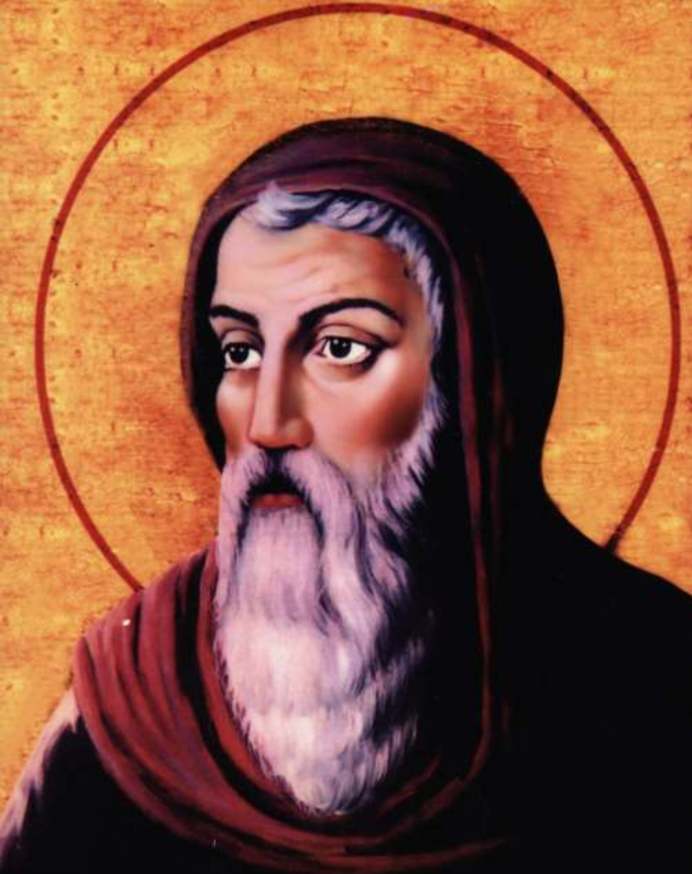
القديس اثناسيوس الرسولي

تذكار من كنيسة السيدة العذراء والقديس اثناسيوس